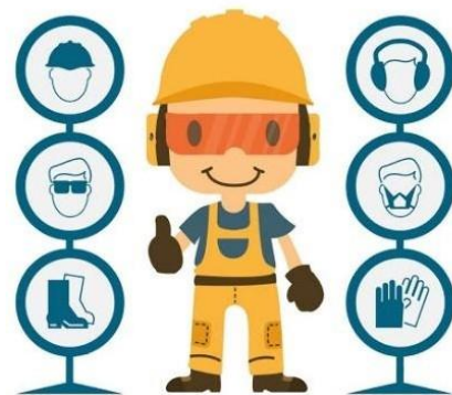
Responsable del SG - SST

• Promover dentro de la empresa y a todos los trabajadores el uso de la aplicación CoronApp para el reporte diario de las condiciones de salud